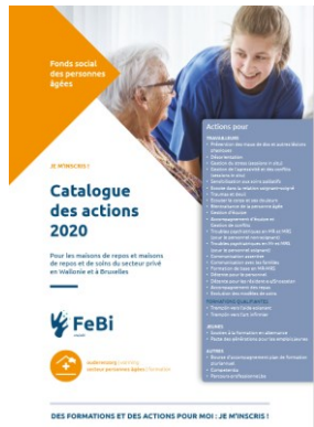
Catalogue des MR/MRS