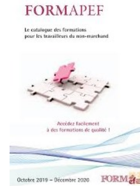
Offre transversale APEF : Formapef