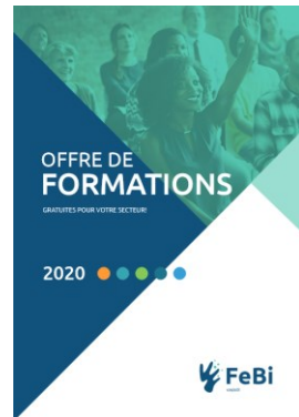
Offre transversale FeBi