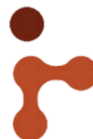
Nom d'un Secteur