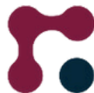
Fonds d'aménagements de carrière