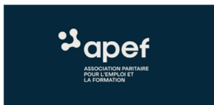
Logo version negative et sa baseline (V)