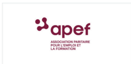
Logo version positive et sa baseline (V)