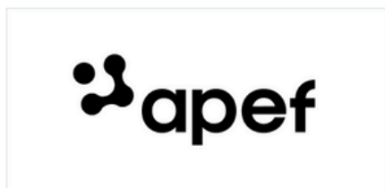
Logo version positive