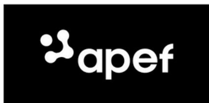
Logo version negative