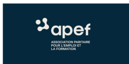
Logo version negative et sa baseline (V)