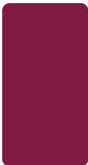
Bordeau HEX: #7F1D40 RVB: 127 29 64

Attention : Pour l'impression, il faudra prendre des couleurs CMJN et tenir compte que le rendu papier diffère toujours de ce que l'on voit à l'écran.