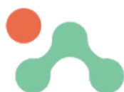
Nom d'un Secteur